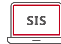
Schlanke Dokumentation nach Strukturmodell