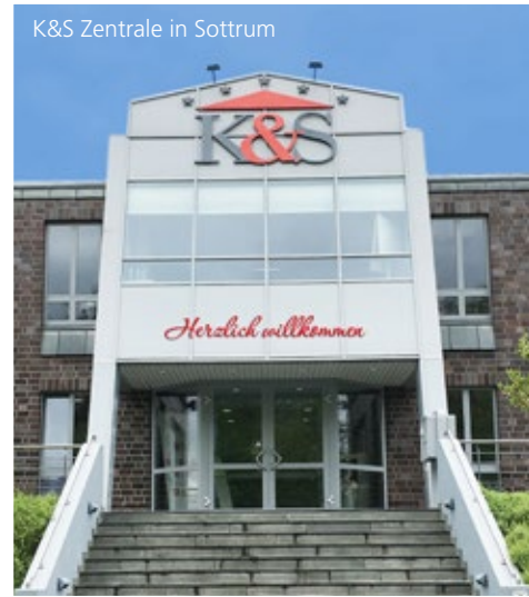
K&S Zentrale in Sottrum

Dafür sprechen auch die sehr guten Bewertungen unserer Leistungen in der Pflege und Betreuung sowie als Arbeitgeber.